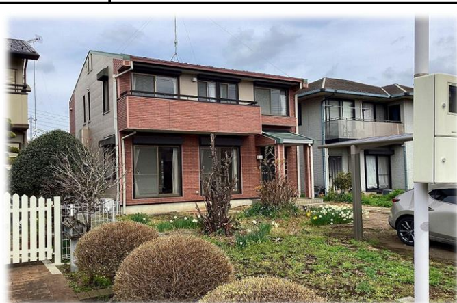
南西側より撮影現地外観 【掲載写真:2024年4月撮影 ※街並み含む】